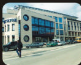
GBRS Banja Luka