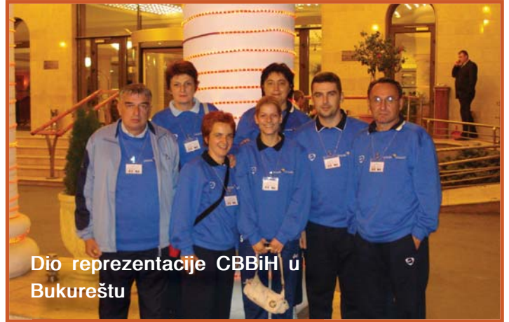
Dio reprezentacije CBBiH u Bukureštu

(žene single), stonom tenisu (muškarci single i double) i tenisu (muškarci single i double). Trofej u šahu za žene otišao je Narodnoj banci Makedonije, a u šahu za muškarce Narodnoj banci Mađarske. Zlatnu medalju u stonom tenisu, žene double, osvojila je ekipa Centralne banke Republike Turske. Zlato u tenisu, žene