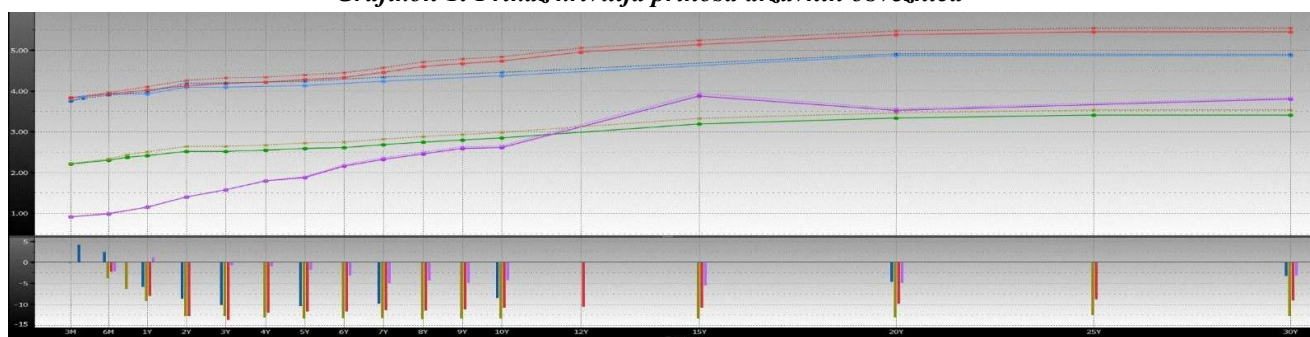
Grafikon 1: Prikaz krivulja prinosa državnih obveznica

Grafikon prikazuje krivulje prinosa Njemačke (zelena), SAD (plava), Velike Britanije (crvena) i Japana (ljubičasta) za razdoblja od 3 mjeseca do 30 godina na dane 26.6.2026. godine (pune linije) i 19.6.2026. godine (isprekidane linije).